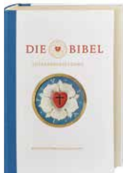
Revidierte Luther- bibel 2017 © Deutsche Bibelgesellschaft