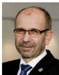
Präses Manfred Rekowski

Fotorechte: Die Fotos sind bei Quellenangabe zur kostenfreien Verwendung mit einem Klick auf das jeweilige Motiv abrufbar.