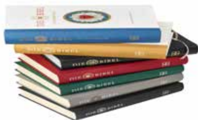
(©) Deutsche Bibelgesellschaft