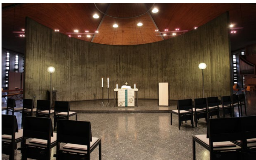
Blick auf den Nebenaltar (kleiner Gottesdienstraum)

Im Reformationsjahr 2017 begannen die konkreten Gespräche zur vertraglichen Regelung der ökumenischen Kirchennutzung. Hierzu wurden die jeweiligen kirchenaufsichtlichen Ebenen in Aachen und Düsseldorf hinzugezogen. Durch ihre jeweiligen Fachreferate haben sie die Gespräche beratend begleitet. Als Problem stellte sich die Frage nach dem Umgang mit gottesdienstlichen Handlungen, die nach der liturgischen Ordnung des Vertragspartners ausgeschlossen sind. Diese Frage konnte durch „die Verpflichtung zu gegenseitiger Rücksicht und Wertschätzung“ und durch die wechselseitige Anerkennung der grundlegenden Bindung der beiden Gemeinden an ihre jeweiligen Agenden bzw. liturgischen Normen geregelt werden. 14 Dieser Lösungsansatz kam unter anderem