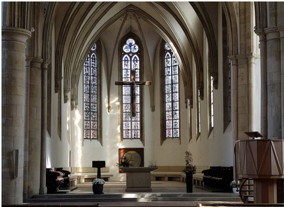
Links: Kreuz, Kanzel, Ambo und Altartisch, Evangelische Apostelkirche, Münster (Westf.)