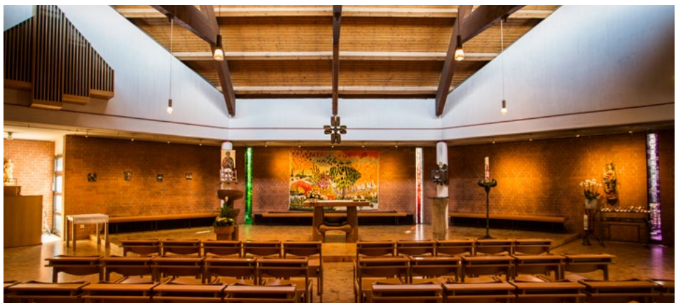
Blick in den katholischen Kirchraum des ökumenischen Zentrums

In diesem Kirchenzentrum sollte es einen gemeinsam genutzten Gottesdienstraum geben. Doch sowohl Präses Hans Thimme wie auch Erzbischof Lorenz Jaeger bestanden darauf, dass es im gemeinsamen Kirchenzentrum zwei getrennte Kirchenräume gibt. Ende 1970 stimmten schließlich beide Kirchenleitungen „dem (letztlich realisierten) Vorhaben zu, in dem neu zu errichtenden Kirchenzentrum eigenständige Gottesdiensträume in getrennter Trägerschaft vorzusehen – die evangelische Jakobus-Kirche und die katholische St. Andreas-Kirche unter dem einen Dach des neuen gemeinsamen Zentrums.“ 23