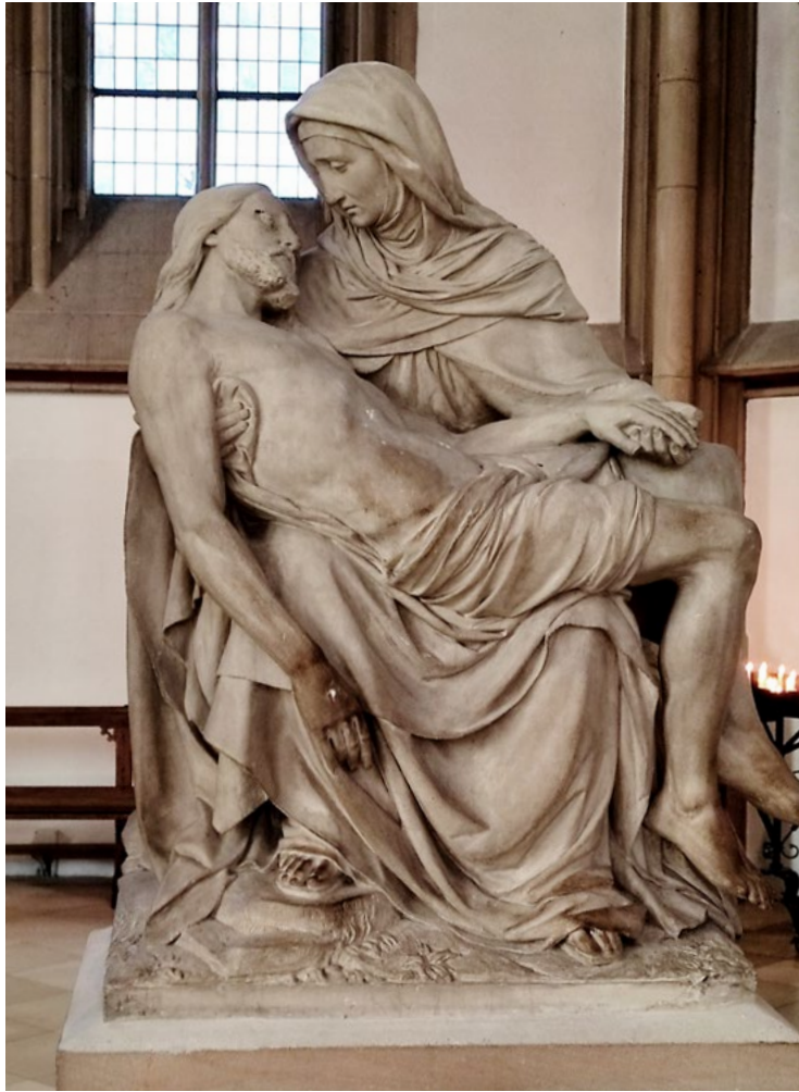
Pietà (Maria mit dem Leichnam Jesu im Arm), Lambertikirche Münster (Westf.)