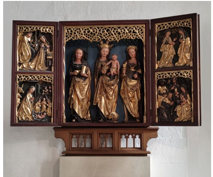
Oben: Marienaltar Tryptichon, Lambertikirche Münster (Westf.)