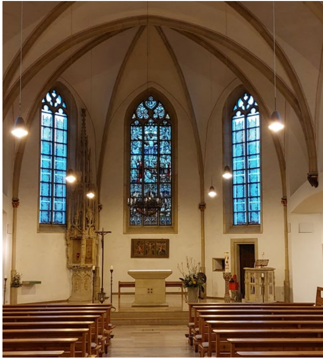
Links: Blick auf das Zentrum der St. Sebastian Kirche: Kreuz, Altar und Ambo. Rechts oben: Skulptur „Die Begegnung“ von Hubert Teschlade Rechts: Blick von der Altarinsel zum Seitenschiff mit Orgelempore