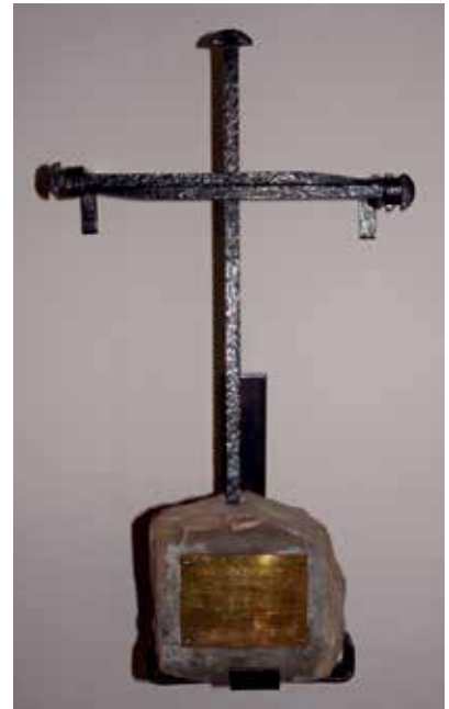
Das Nagelkreuz aus Coventry in der evangelischen Kirche Barmen-Gemarke.

In der evangelischen Kirche Barmen-Gemarke befindet sich seit zehn Jahren ein Nagelkreuz aus Coventry. Es steht als weltweites Zeichen der Versöhnung, des Friedens und der Feindesliebe; allein in Deutschland gibt es 62 Nagelkreuzzentren. Dort engagieren sich Menschen, um alte Gegensätze zu überbrücken und nach neuen Wegen in eine gemeinsame Zukunft zu suchen. Die Nagelkreuzarbeit ist ein Schwerpunkt in der Arbeit der Gemarker Kirche geworden. Dazu zählen das wöchentliche Versöhnungsgebet freitagmittags, Gottesdienste zum Tag des Gedenkens an die Opfer des Nationalsozialismus am 27. Januar und zum Gedenken um den 9. November herum sowie besondere Kantatengottesdienste, beispielsweise in der Vergangenheit zum 70. Jahrestag der Zerstörung Coventrys 2010 oder zum 70. Jahrestag des britischen Luftangriffs auf Barmen 2013 mit Geistlichen aus Coventry. Thematische Veranstaltungen wie etwa eine kleine Vortragsreihe zur Rolle der Kirche im Ersten und Zweiten Weltkrieg ergänzen das Angebot.